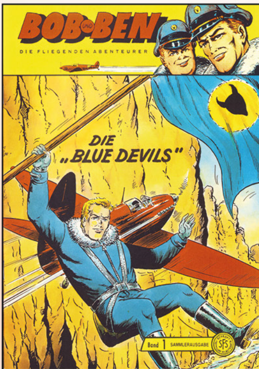
Bob und Ben im Hethke Verlag